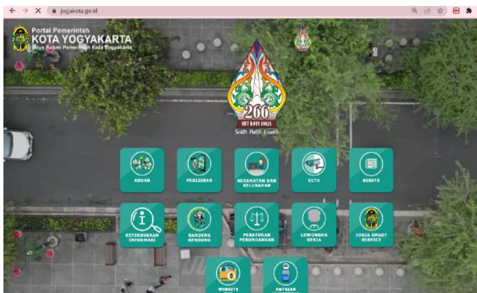
Gambar 1. Tangkapan Layar Portal jogjakota.go.id

Untuk media website, Pemerintah Kota Yogyakarta telah memuat informasi publik pada portal jogjakota.go.id . Informasi tersebut juga dapat diakses pada subdomain ppid.jogjakota.go.id . Pada tahun 2019, seluruh Perangkat Daerah/Unit Kerja hingga di tingkat Kelurahan telah memiliki dan mengelola Sub Domain/Website. Konten informasi publik di setiap subdomain ini diupayakan memuat informasi publik yang sesuai dengan ketentuan dalam Pasal 9, 10, dan 11 UU KIP mengenai informasi yang wajib disediakan dan diumumkan secara berkala, informasi yang wajib diumumkan serta-merta, dan informasi yang wajib tersedia setiap saat.